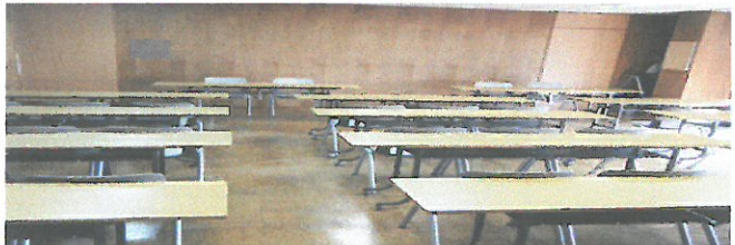
2階 第二(小)会議室 30~40名