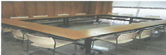
2階 第一(小)会議室 16~20名