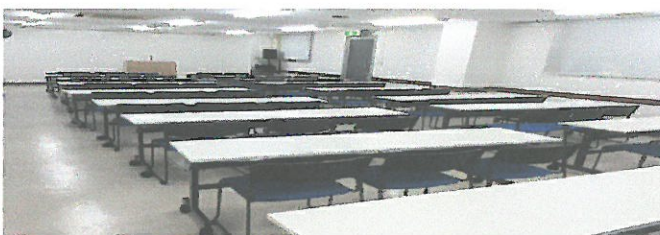
1階ホール(多目的) 50~60名