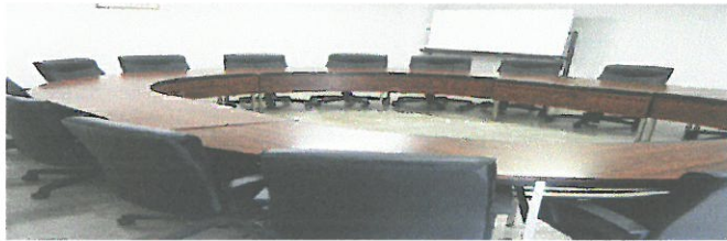
2階 会議室(円卓) 18名