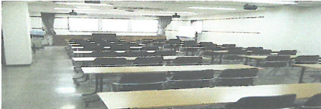
3階 会議室(中) 50~60名