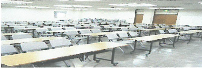
3階 会議室(大) 120~150名