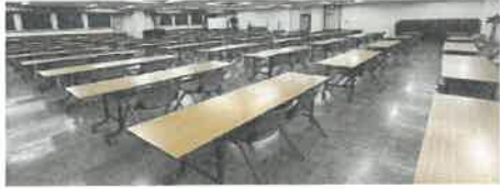
3階 大会議室 94～141名